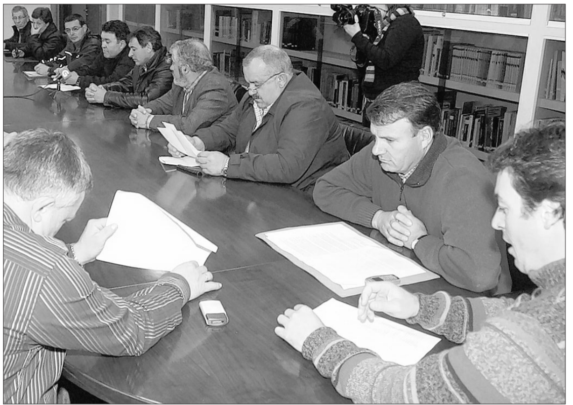
Asamblea de patrones mayores de la ría de Arousa.

De todas formas, el grovense está dispuesto a respaldar a Amigo para alcanzar un objetivo que se le resiste a las cofradías gallegas, pese a ser primera potencia en los sectores de la pesca de bajura y del marisqueo. De hecho, la unión es el principal aval que pretende poner encima de la mesa en la elección de presidente de la Federación estatal y evitar que vuelva a ocurrir lo mismo que hace cuatro años, cuando las cofradías gallegas se presentaron divididas entre los que apoyaban a José Antonio Gómez, patrón mayor de