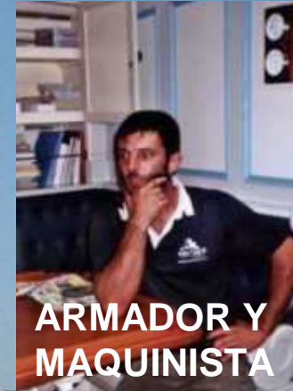
ARMADOR Y MAQUINISTA