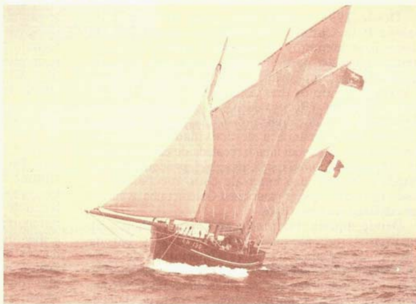
Bisquine "AMI PIERRE" construída por el taller de carpintería del museo marítimo de Tatihou.