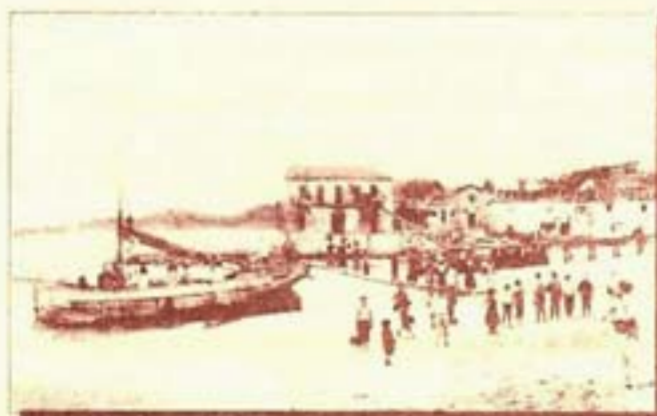
Bueu, Praia de Pescadoira a principios do século XX