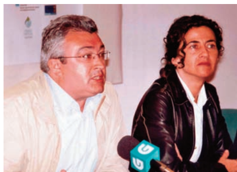
Outro momento da presentación do Encontro.

Quen se achegue en xullo ó peirao das Curuxeiras para gozar do VIII Encontro, que procure tamén visitar o Arsenal, peza fundamental da arquitectura naval militar contemporánea europea, xa que a Mariña de Guerra da Armada Española abrirá esas instalacións os días do Encontro; e que non esqueza visitar o barrio da Magdalena, centro histórico da cidade, para poder gozar da beleza xeométrica dese rectángulo de rúas lonxidunais e rectilíneas cruzadas por outras perpendiculares. É a herdanza de enxeñeiros como Jorge Juan ou Julián Sánchez Bort, que no século XVIII converteron a viliña mariñeira de Ferrol nunha cidade moderna.