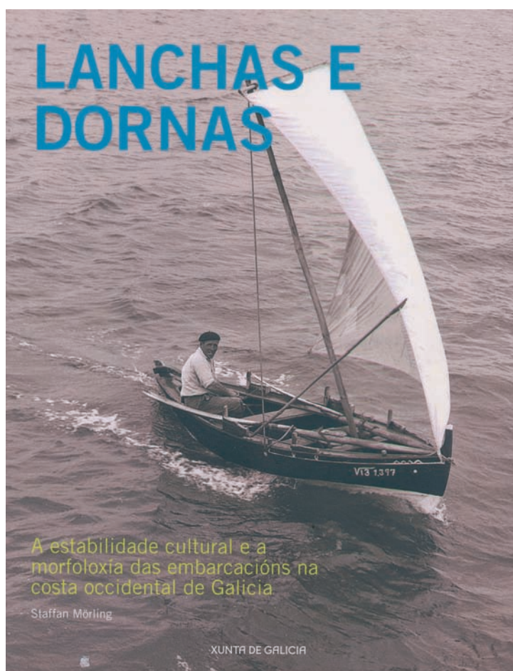
Portada de Lanchas e Dornas

O acto académico, dunhas dúas horas e media de duración, non cansou nin aborreceu os asistentes que aba-