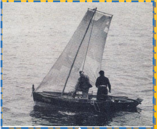
Dorna polbeira con vela de relinga, arribando ao peirao da Illa de Ons.