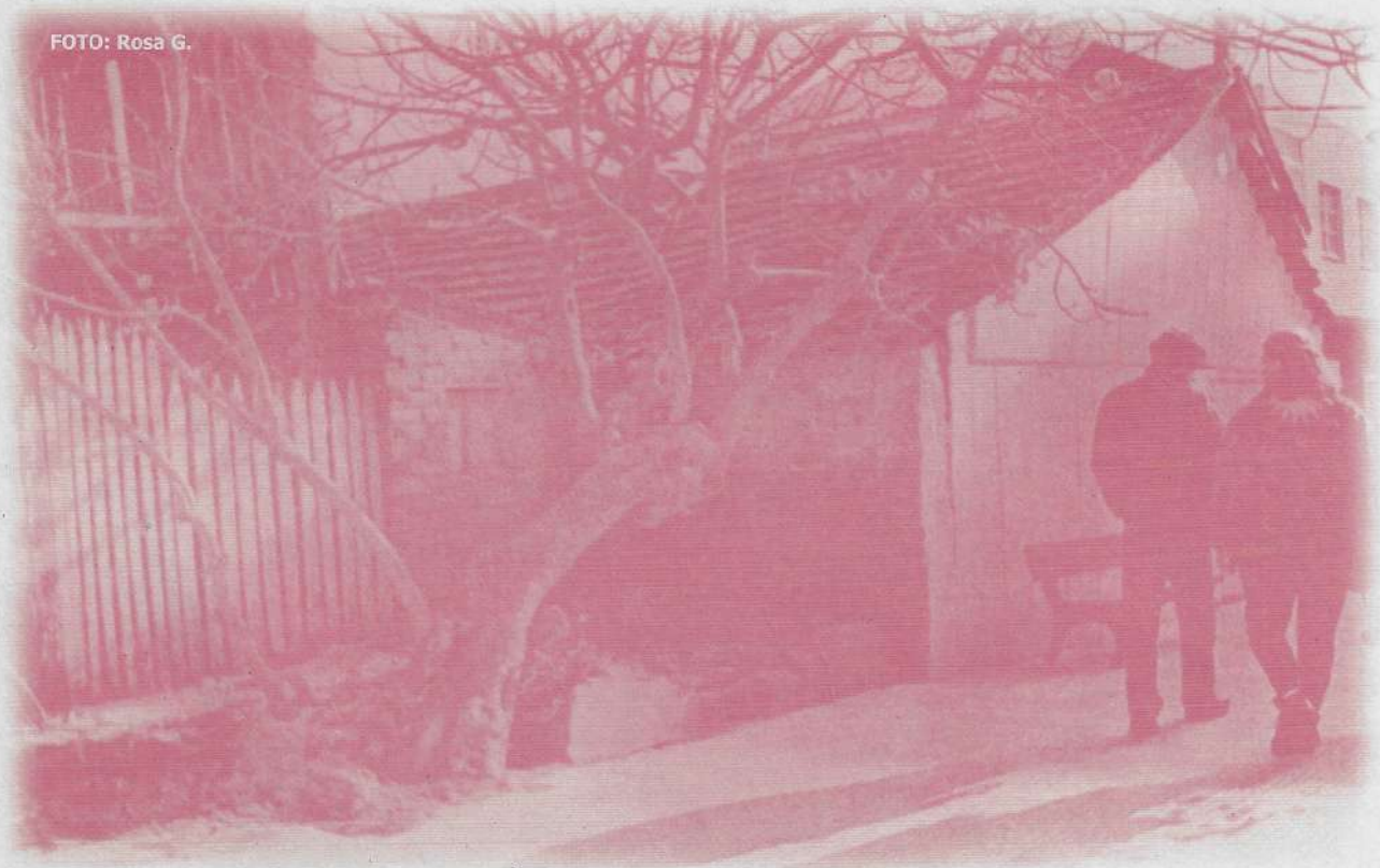
Astaleiro de "Purros" (Bueu)