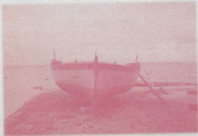
Bote Polbeiro "Lagoas"

Os botes polbeiros tamén recibían o nome de "Galos", según se di, pola arrogancia coa que surcaban as augas. Estas embarcacións se pintaban todas iguais : a obra viva de patente bermella e a obra morta de cor azul.